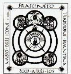
Museo delle Icone e della Tradizione Bizantina