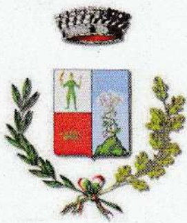
Comune di Frascineto Bashkia e Frasnitës