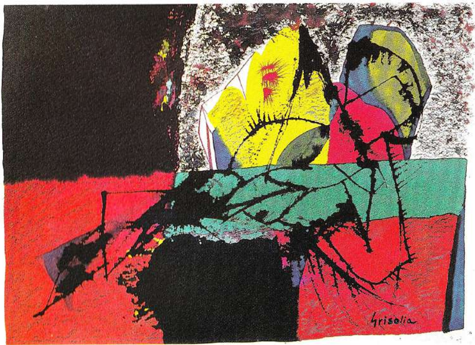
Falena / Tecnica mista su carta, cm. 50x68 - 1991