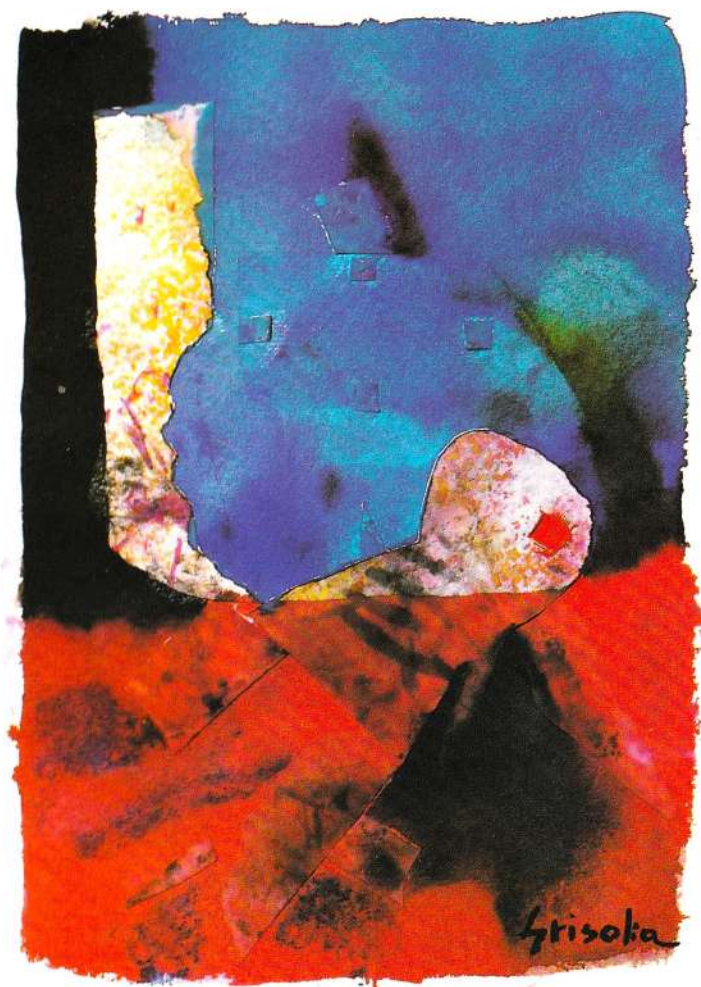
Nel rosso della notte / Tecnica mista e collage su carta, cm. 61,5×43 - 1990