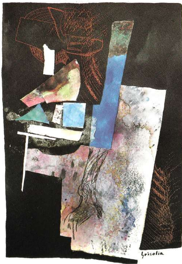
Senza titolo / Tecnica mista e collage su carta, cm. 66x49 - 1991