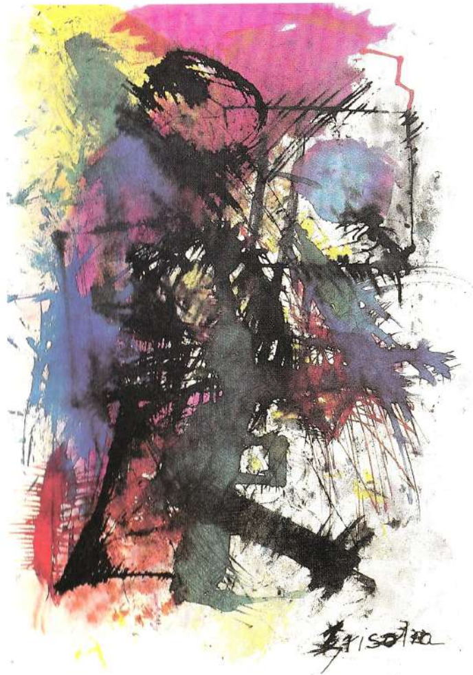
Senza titolo / Inchiostro su carta, cm. 66x45 - 1991