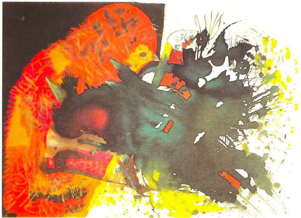
Senza titolo / Tecnica mista su carta, cm. 49x61 - 1991