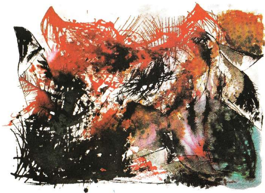
Le ali di Icaro / Inchiostro su carta, cm. 44x62 - 1990